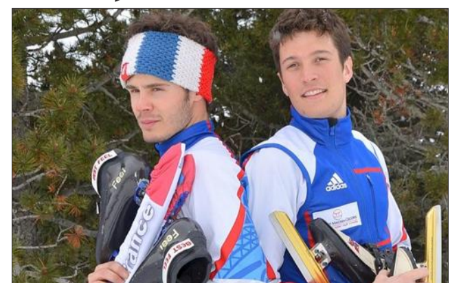
En raison de la non-qualification du relais pour le premier et d'une blessure pour le second, Jérémy Masson et Thibault Crolet n'iront pas à Sotchi.