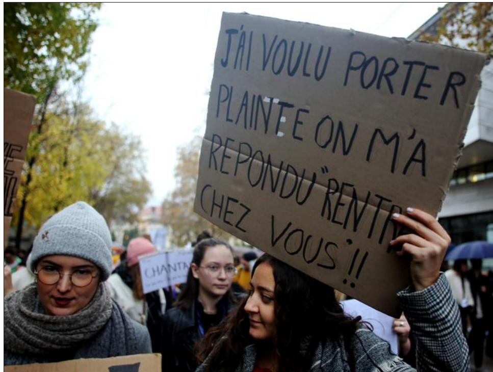
Le 23 novembre 2019, une manifestation contre les violences sexuelles et sexistes a eu lieu à Grenoble.

Depuis 2012 et à la demande de la municipalité, l’association intervient désormais à Albertville. Chaque premier et troisième lundis du mois de midi à 16 heures. Ces permanences sont accessibles à toutes sur rendez-vous. « Il faut appeler à l’accueil de Chambéry pour prendre rendez-vous. Pour celles qui ne souhaitent pas procéder de cette manière nous faisons aussi de l’accueil par téléphone du mar-