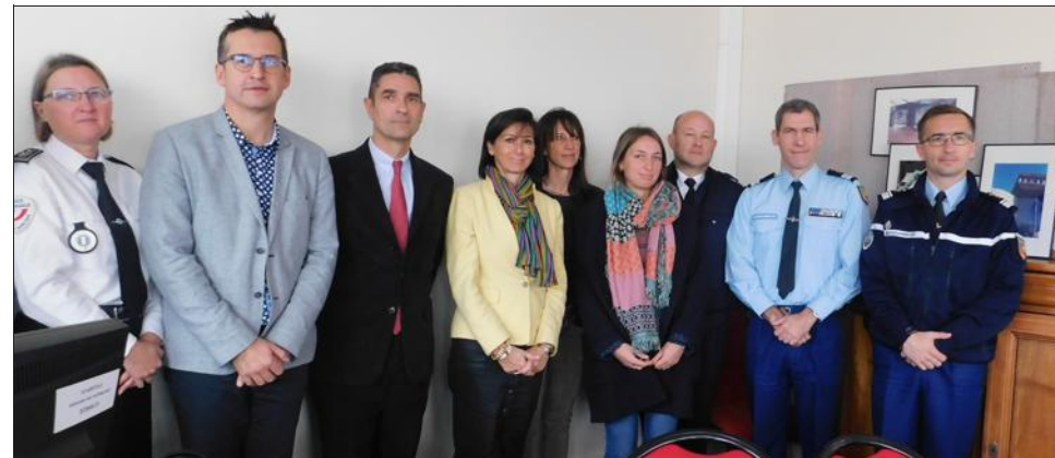
Une convention a été signée entre le centre hospitalier, le préfet et les autorités judiciaires lundi 25 novembre 2019, à l’occasion de la journée internationale de lutte contre les violences faites aux femmes.

Pour la première fois dans le département, une convention vient renforcer la prise en charge et le suivi des victimes de violences conjugales en mettant place, au sein de l’hôpital, un espace d’accueil destiné à faciliter les dépôts de plainte.